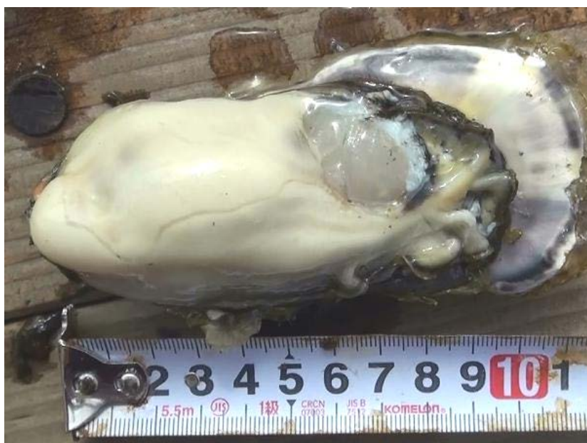
図-1 マイクロバブル育ちのバージンオイスター（2011年11月14日）

今後の人生のあり方を決めるような大変重要な実装経験をさせていただき、深く感謝を表す。今後とも、支援活動を継続して、水産養殖の復興、新水産業の形成が可能となるような社会貢献を遂行させていただきたいと切に願っている。